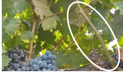
צהבון - חוסר התעצות