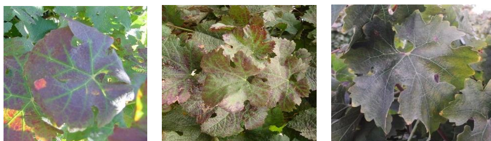
וירוס קיפול העלים