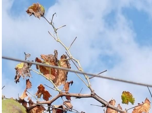
פירס - פטוטרות ללא טרפים