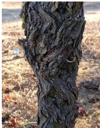
התנוונות השיראז (סירה) - עיוותים על הגזע

האמור לעיל הינו בגדר עצה מקצועית בלבד ואינו מהווה חוות דעת מומחה לצורך הצגה כראיה בהליך משפטי. על מקבל העצה לנהוג מנהג זהירות, ושימוש או הסתמכות על המידע המופיע לעיל הינו באחריות מקבל העצה בלבד. אין להעתיק, להפיץ או להשתמש במסמך זה או בחלקים ממנו לצורך הליך משפטי כלשהו, ללא אישור מראש ובכתב של החתומים.