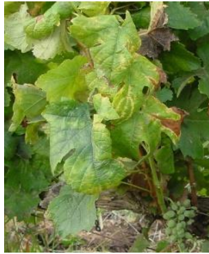
תמונה 6: מופע המחלה בקולומברד

צהבון (פיטופלסמה) - נגרם מחיידק הפוגע ברמות שונות בזנים שונים (הזן שרדונה הוא הרגיש ביותר). לא מצאנו בישראל את מקור המחלה - אם הוא מגפנים או מצמח אחר כלשהו. התסמינים של הצהבון יכולים להופיע מיד לאחר החנטה, אך גם מאוחר יותר - עד ערב הבציר, והם מתבטאים בעלים בשינוי גוון ובהתקפלות לאחור; בשריגים בחוסר התעצות הגורם לנטייתם כלפי מטה; ולהתנוונות של האשכולות. ברוב הזנים חלק ניכר מהגפנים מצליח להתגבר ולהבריא מהמחלה בשנים העוקבות והחיידק נעלם מהן. בנוסף, על סמך פיזור המחלה בחלקות, לא נראה שגפן נגועה מהווה מקור משמעותי להדבקה, ולכן אין משמעות לעקור גפנים נגועות.