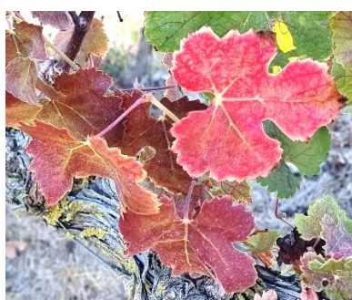
התנוונות הסירה (שיראז)