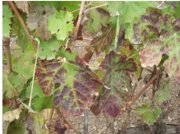
תמונה 4: מופעים של מחלת קיפול העלים בזן אדום