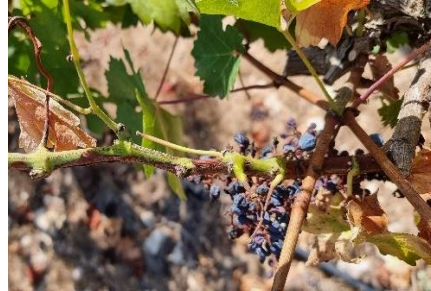
פירס - התעצות לא מסודרת