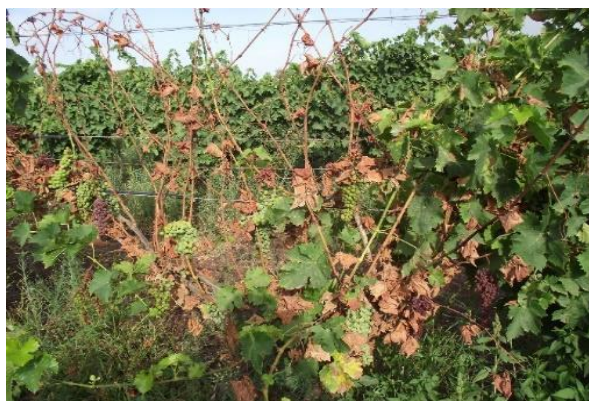
תמונה 3: אסקה - התמוטטות של הגפן