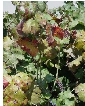
תמונה 5: מופע המחלה בקברנה סוביניון