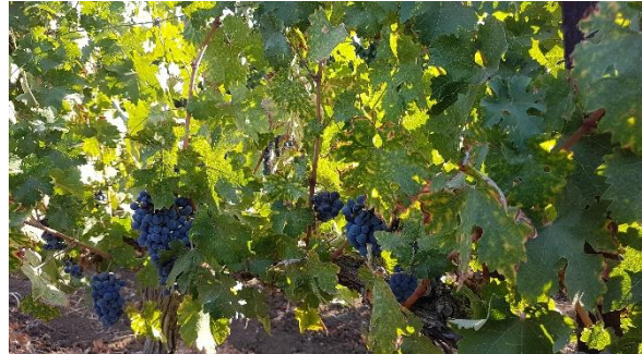
תמונות 1-2: אסקה - רמות של נזקים